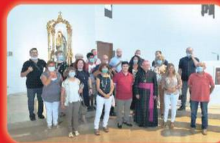
Coro Parrocchiale Francesca & Co